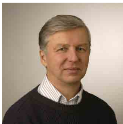
Prof. Lennart Hardell

Beim Treffen der IARC debattieren die Autoren, was für und gegen die Klassifizierung von elektromagnetischen Hochfrequenzfeldern als „möglicherweise krebserregend für den Menschen“ spricht, Gruppe 2B 7,8 . Eine besondere Aufmerksamkeit sollte dabei Artikeln geschenkt werden, die nach der IARC-Entscheidung herauskamen. Einige wissenschaftlich überprüfte Artikel, die in jüngerer Vergangenheit veröffentlicht wurden, werden jedoch in ihrer Darlegung (gemeint Samet et al., d.Ü.) entweder falsch interpretiert oder weggelassen. Ein Beispiel sind die drei Berichte unserer Forschungsgruppe, die frei im Internet verfügbar sind, zu Meningeomen (19. Juli 2013) 9 , Akustikusneurinomen (22. Juli 2013) 10 sowie zu bösartigen Hirntumoren (24. September 2013) 11 . Das Weglassen dieser Artikel ist