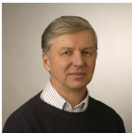
Prof. Lennart Hardell

Beim Treffen der IARC debattieren die Autoren, was für und gegen die Klassifizierung von elektromagnetischen Hochfrequenzfeldern als „möglicherweise krebserregend für den Menschen“ spricht, Gruppe 2B 7,8 . Eine besondere Aufmerksamkeit sollte dabei Artikeln geschenkt werden, die nach der IARC-Entscheidung herauskamen. Einige wissenschaftlich überprüfte Artikel, die in jüngerer Vergangenheit veröffentlicht wurden, werden jedoch in ihrer Darlegung (gemeint Samet et al., d.Ü.) entweder falsch interpretiert oder weggelassen. Ein Beispiel sind die drei Berichte unserer Forschungsgruppe, die frei im Internet verfügbar sind, zu Meningeomen (19. Juli 2013) 9 , Akustikusneurinomen (22. Juli 2013) 10 sowie zu bösartigen Hirntumoren (24. September 2013) 11 . Das Weglassen dieser Artikel ist