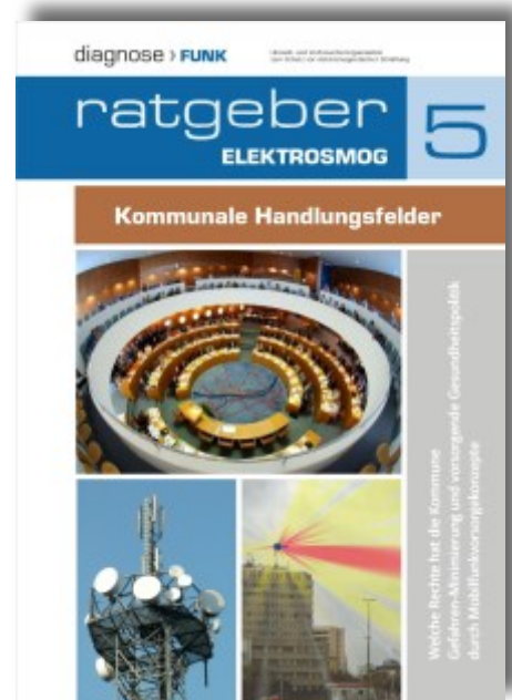
Der neue Ratgeber: 44 Seiten, farbig.

http://diagnose-funk.org/empfehlungen/kommunale-handlungsfelder/index.php