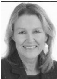
Sylvia Kotting-Uhl, MdB

Atompolitische Sprecherin der Bundstagsfraktion BÜNDNIS 90/DIE GRÜNEN, Mitglied im Ausschuss für Technikfolgenabschätzung und stellv. Mitglied im Ausschuss für Umwelt, Naturschutz und Reaktorsicherheit referiert